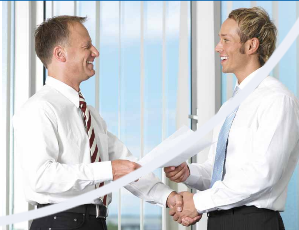
Itella Information Partner Program varmistaa, että asiakkaat saavat palvelut vaivattomasti käyttöönsä.

Itella Information Partner Program varmis-